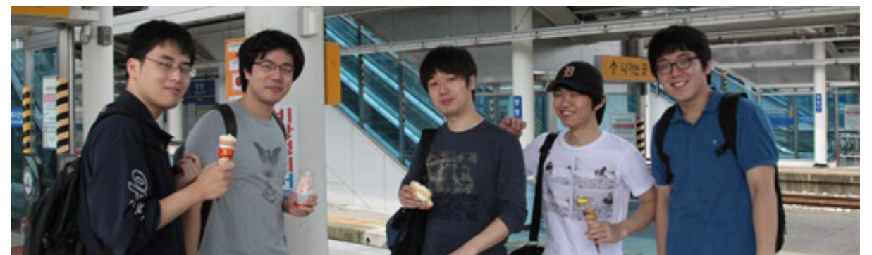
그림 모임 매주 진행 좋은 전시회가 있을 때마다 전시회 관람 뛰어난 아이디어가 있을 때마다 기행 착수