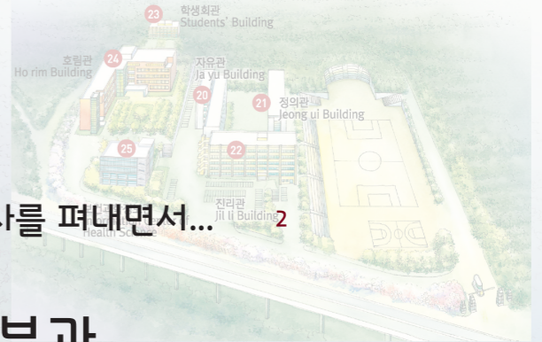
보건과학대학 (서울시 성북구 정릉3동 산 1번지)